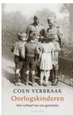
Nederland; Wereldoorlog II